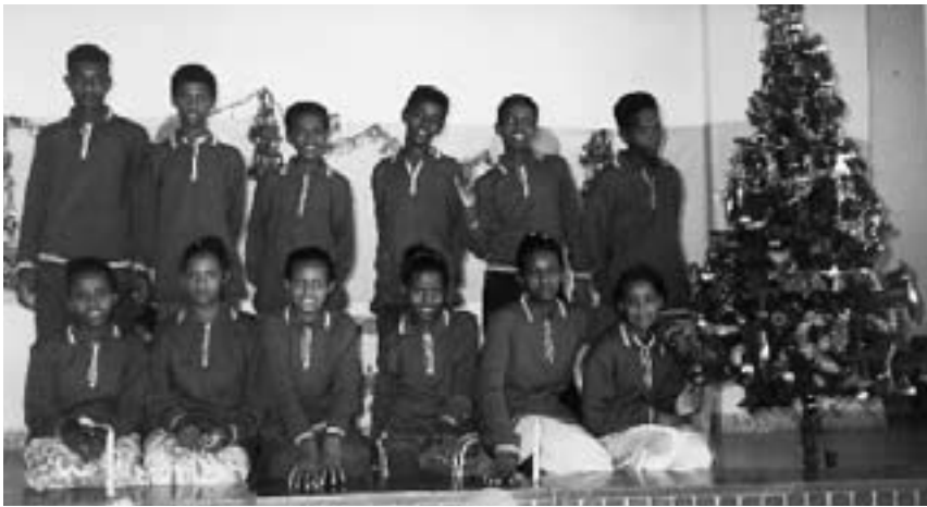
De glade børn på Døveskolen i Keren holdt julefest med rigtig juletræ – og iført deres fine grønne skoleuniformer.

doms jul med stor glæde. Da han havde fået en veninde til at male et billede af sit barndomshjem, skrev han disse vers til: