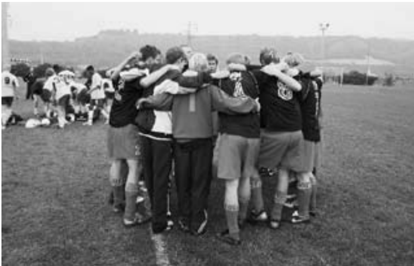
»Teamtalk« inden en vigtig kamp!

Og så var vi så heldige at have bussen og de to chauffører til vores rådighed under opholdet i Italien. Det betød at vi kom på sight-seeing i området hver dag, så drengene fik set en pæn bid af Italien, inklusive storbyerne Milano og Verona. Og det var jo væsentligt for udbyttet af turen, at drengene fik set andet end fodboldbaner, når nu vi var rejst helt til Italien. En økonomisk håndsregning fra Lions Club gjorde det muligt at få dækket de ekstra transportudgifter til parkering og motorvejsafgifter på udflugterne; så det var vi virkelig glade for.«