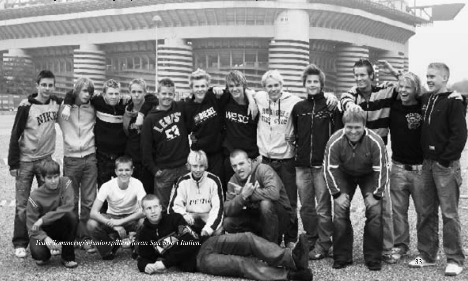
Team Tommerup's juniorspillere foran San Siro i Italien.