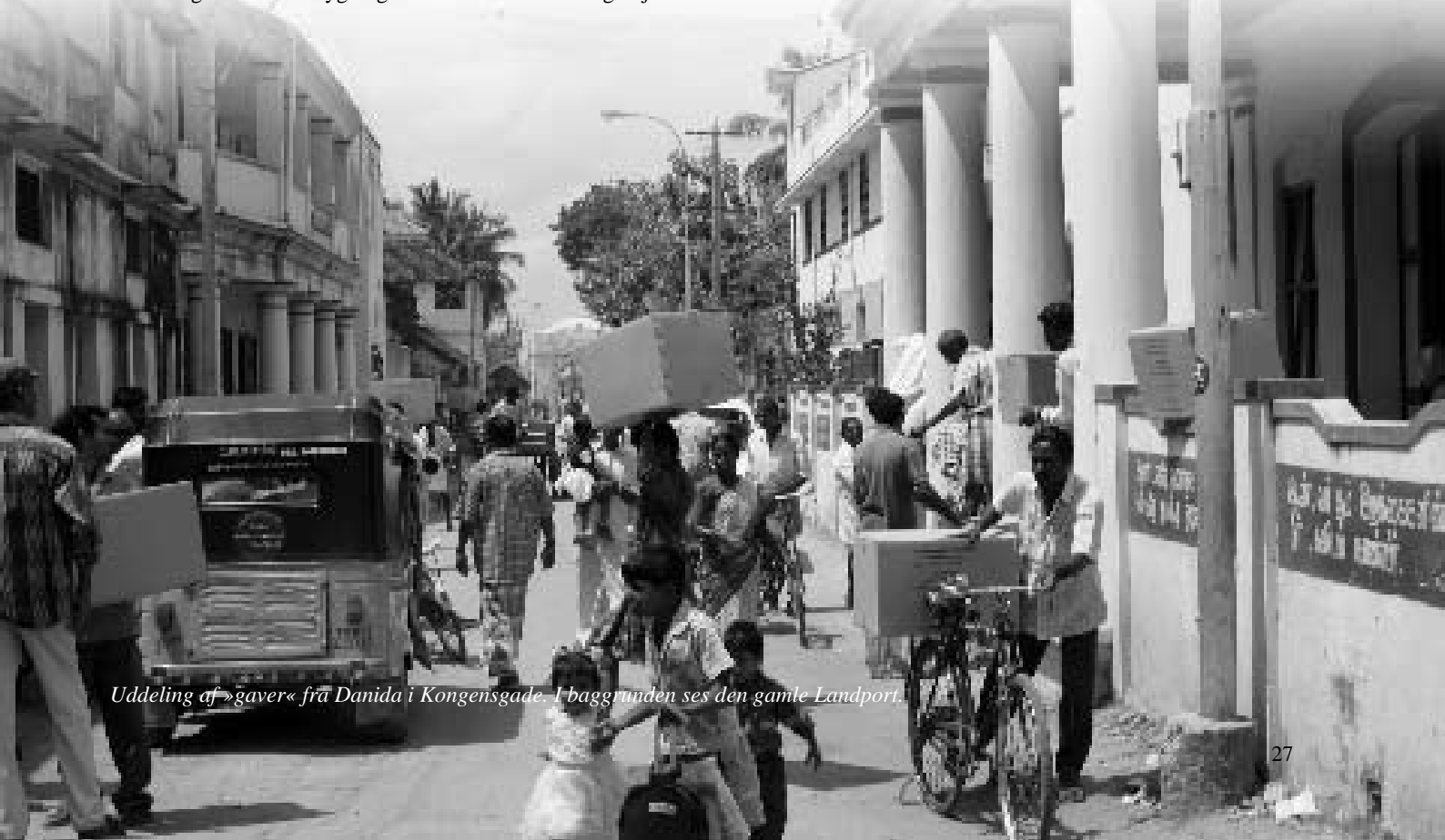
Uddeling af »gaver« fra Danida i Kongensgade. I baggrunden ses den gamle Landport.

Mere om Trankebar på: www.vestfynsefterskole.dk og Foreningen Trankebars hjemmeside: www.trankebar.net.