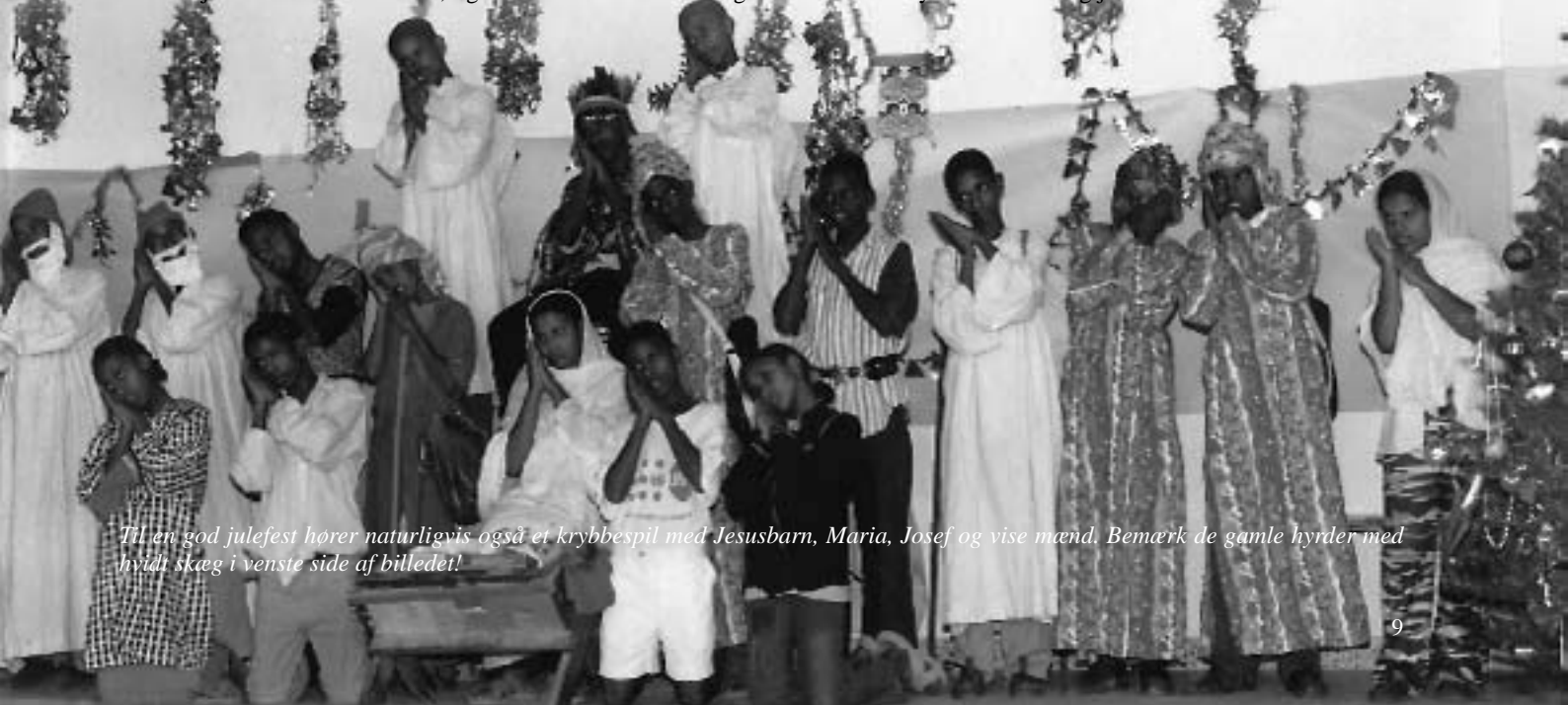
Til en god julefest hører naturligvis også et krybbespil med Jesusbarn, Maria, Josef og vise mænd. Bemærk de gamle hyrder med hvidt skæg i venste side af billedet!

Og så lige til sidst: »Den største glæde er glæden ved at gi'«, har én sagt. Da min familie og jeg besøgte landet Eritrea i Afrika i efteråret 2004, var der mange ting, der gjorde stort indtryk på os. Ikke bare fattigdommen, men også gæstfriheden, taknemligheden og den smittende livsglæde. Vi besøgte bl.a. de glade og dygtige børn på døveskolen i Keren, som drives af kirken derude, og kort før jul modtog de en gave her fra Tommerup – samlet ind ved det eftermiddagsmøde, hvor vi fortalte om vor tur til Eritrea. Den gave holdt de bl.a. julefest for på døveskolen, fortalte skolelederen os senere, og så sendte han i øvrigt en hilsen til Tommerup med ordene fra Salme 41, vers 2 i Det gamle Testamente: »Lykkelig den, der har omsorg for de svage«. Så måske er det dét, der er hemmeligheden ved julen, – at man ved at gøre lykkelig selv bliver lykkelig! Glædelig jul!