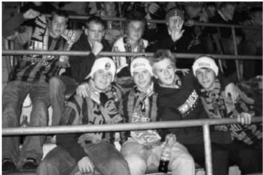
Højt humør på lægterne!

Lørdag d. 15. oktober drog 17 spillere, 2