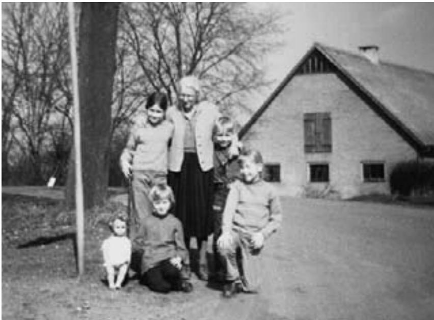
Mormor sammen med os børn.

Jeg glemmer aldrig første gang, da jeg så en hvinende gris, skræmt fra vid og sans, løbe over gårdspladsen, til den store træbalje med kogende vand. Her fik den et skud for panden og et snit i halsen, hvorfra blodet, i en tyk, varm stråle, løb ned i en spand. Slagteren rensede grisen og kradsede alle de stride børster af den. Derpå bandt han grisen fast på en stige, som blev skubbet op mod husmuren. Der hang så den nøgne, skaldede og store, slappe gris. Mine øjne var så store som møllehjul. Siden skulle tungen sætte sig fast i halsen på mig og jeg tabte mælet og gloede, da slagteren med en skarp kniv snittede en stor revne i grisens bug, hvorefter varme, ildelugtende og dampende indvolde langsomt gled ud og ned ad grisen.